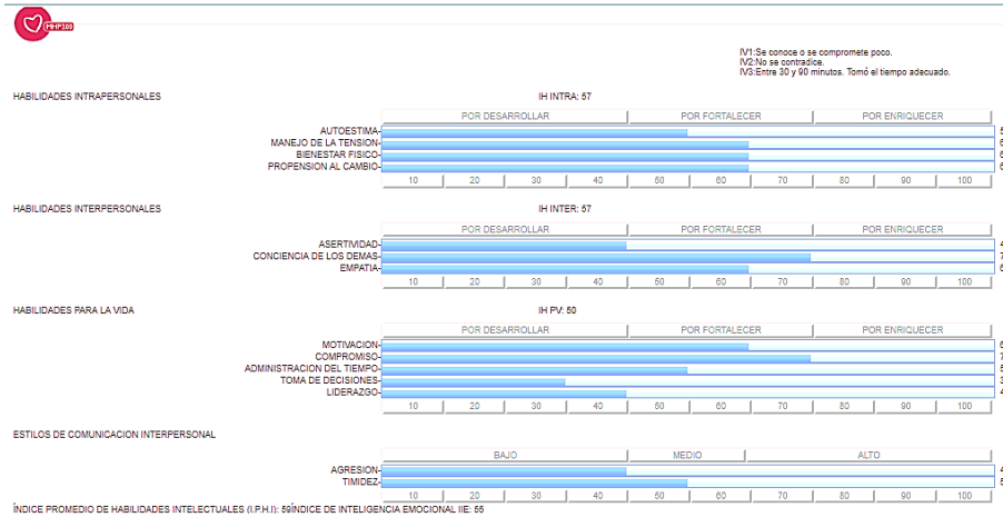
Figura 2. Ejemplo de un diagnóstico de habilidades socioemocionales (Unisoft, 2019).

Si bien esta prueba busca brindar información sobre los aspectos socioemocionales del aspirante, es una prueba con la debilidad de ser manipulable, pues se conforma por afirmaciones que el candidato debe aseverar o refutar en relación a su comportamiento familiar, amistoso y personal, mismo que al momento de responder la prueba, el estudiante puede caer en responder lo que se espera de él y no lo que es. Por esta misma razón y conforme a los resultados en los puntajes (la media es 40-70) percibidos de las aplicaciones, tomamos bajo reserva esta prueba en la integración de los resultados individuales.