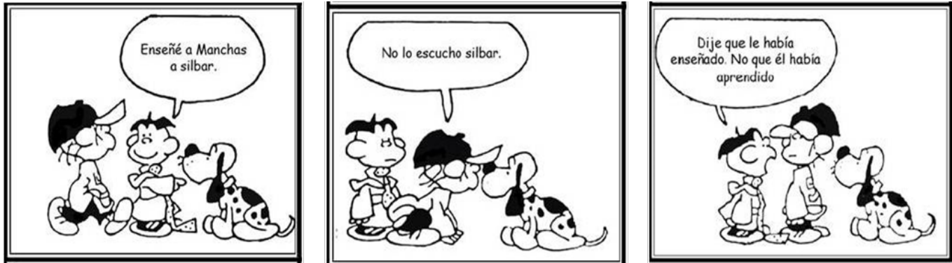
Figura 1 / “¿Enseñanza o aprendizaje?” (Google)

Es por ello que en mi propuesta pretendo compartir estrategias en clase para cerrar lo más posible esas brechas o lagunas de conocimiento o habilidad en los estudiantes en clase, independiente de la modalidad o nivel educativo. Hoy más que nunca esto es posible gracias a la tecnología y a las plataformas de aprendizaje que permiten la personalización de materiales, recursos y actividades, de acuerdo a las necesidades de los alumnos debido a sus diferencias.