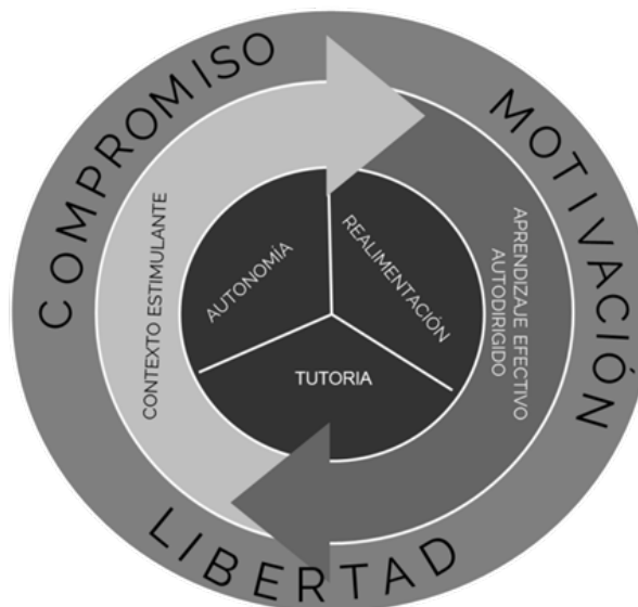
Figura 3 / “Modelo heuragógico UPAEP Online” (Composición Propia)

En esta gestión heuragógica de clases, se promueve la libertad, la autonomía y la motivación, para que el estudiante formule hábitos de estudio y aprendizaje personalizado, convirtiéndose en un “aprendiz maduro”.