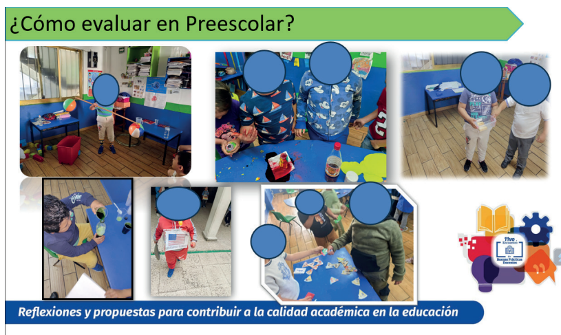
Figura 3. Evidencias de actividades que se realizaron en los proyectos