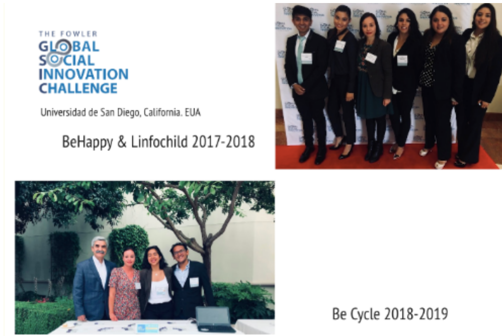
Foto 1. Finalistas Reto Global de Innovación Social 2017-2019

Fuente: Elaboración propia. (Julio, 2022)