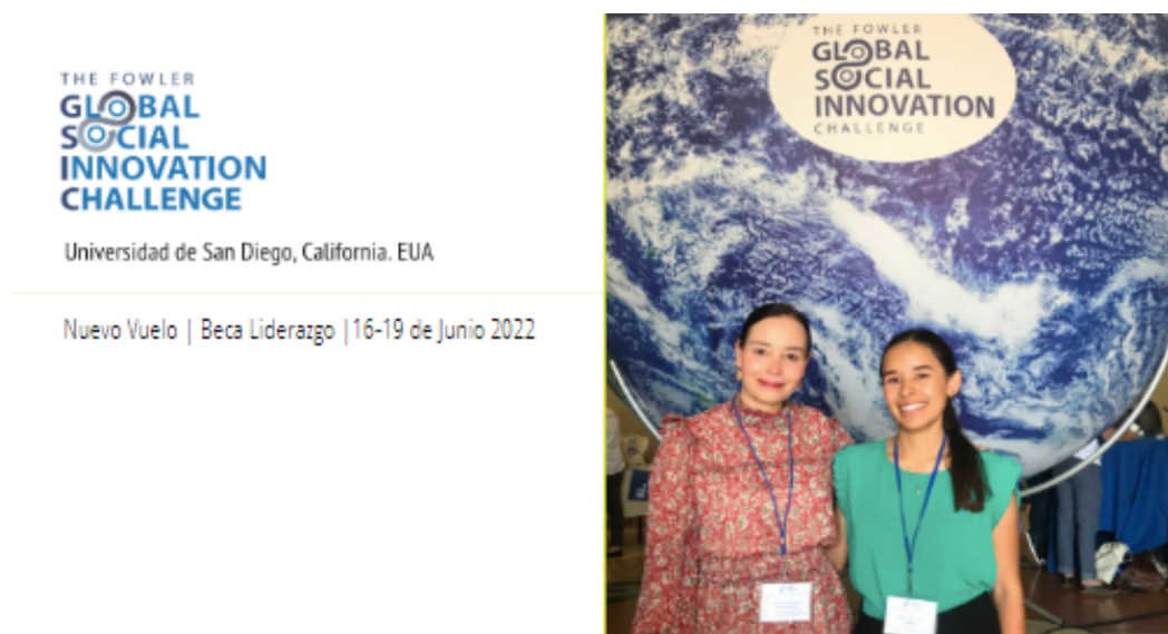
Foto 2. Finalista Reto Global de Innovación Social 2022.

Fuente: Elaboración propia. (Julio, 2022)